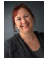
Redaktion & Layout Daniela Hummel Sekretariat